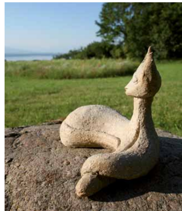
Ici et là, des animaux sculptés face à la quiétude du paysage où l'eau de l'étang rejoint celle du lac et l'immensité du ciel.