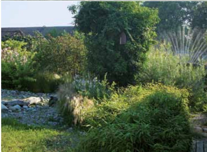
Un talus façonnés comme s'il avait toujours existé et un espace où les oiseaux se sentent en intimité.